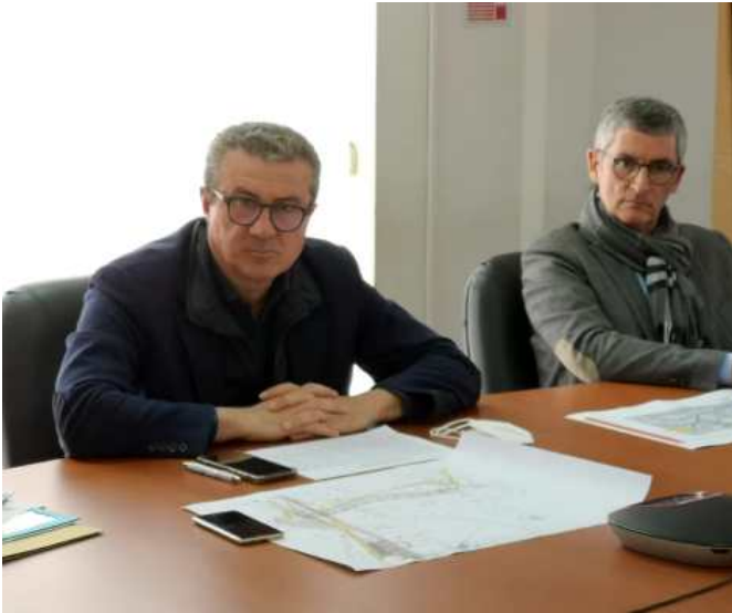
Assessore Toto Cordaro e dirigente generale dipartimento dell'Urbanistica Calogero Beringheli